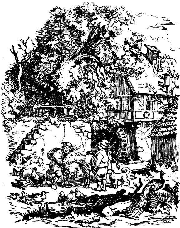
Das idyllische Bild von Mühle und Müller entsprach nicht immer der Wirklichkeit, die von enger Einbindung in das allgemeine Wirtschaftsleben geprägt war (Illustration von Ludwig Richter zu Bechsteins Märchen, 1857).

Da die Anlage weiterer Mühlen im Bannbezirk den Profit